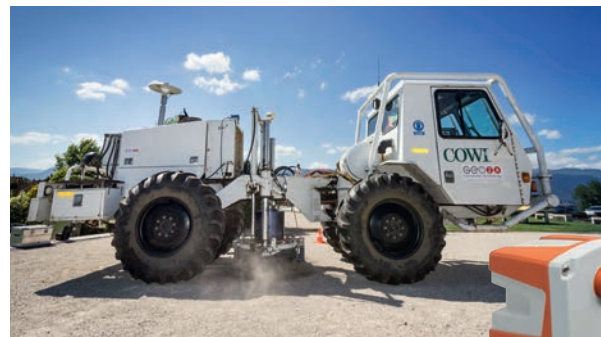
Camion vibreur et capteur «géophone» utilisés lors de la phase de prospection.

GEothermies vise à améliorer la connaissance du sous-sol genevois et à élaborer le cadre institutionnel favorable au développement de cette énergie. Piloté par l'Etat de Genève, ce programme est financé et mis en œuvre par SIG. Il est articulé en trois phases: la prospection, l'exploration par forage et l'exploitation.